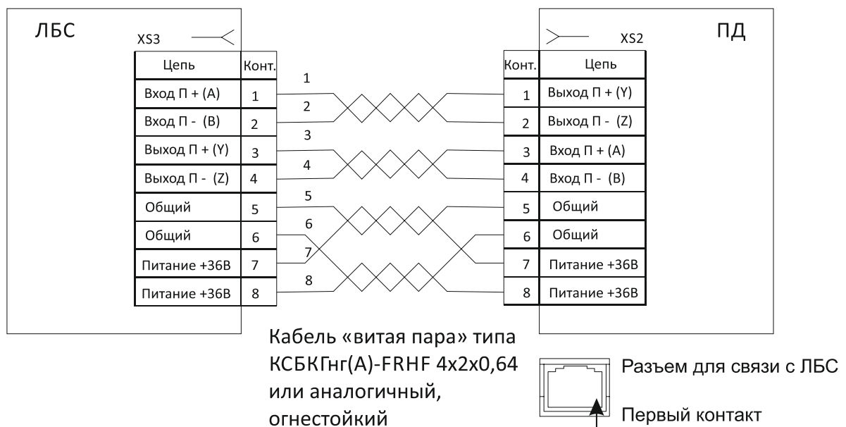
Рис. 3. Схема подключения Тромбон – СОРС – ПД к ЛБС.

Схема подключения Пульта диспетчера Тромбон – СОРС - ПД к ЛБС представлена на рисунке 3.