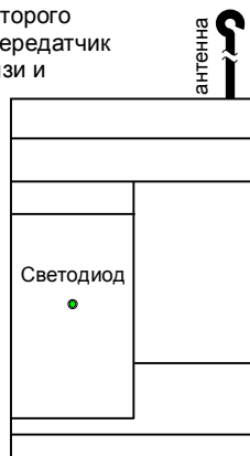
Рис. 1. Внешний вид передатчика

Перед использованием передатчика необходимо установить нужную частотную литеру с помощью джамперных перемычек согласно таблице.